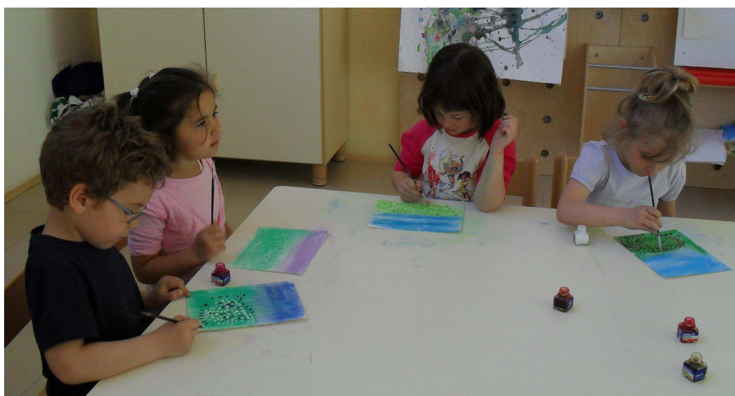
I bambini della scuola dell'infanzia di Pizzano (BO)

Una tecnica interessante: lo sfondo realizzato con i gessi colorati e i fiori con tocchi di china.