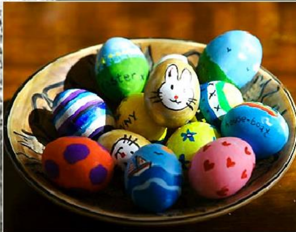
HUEVOS DE PASCUA