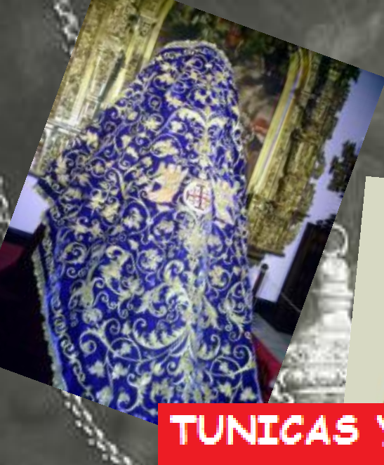
TUNICAS Y MANTOS