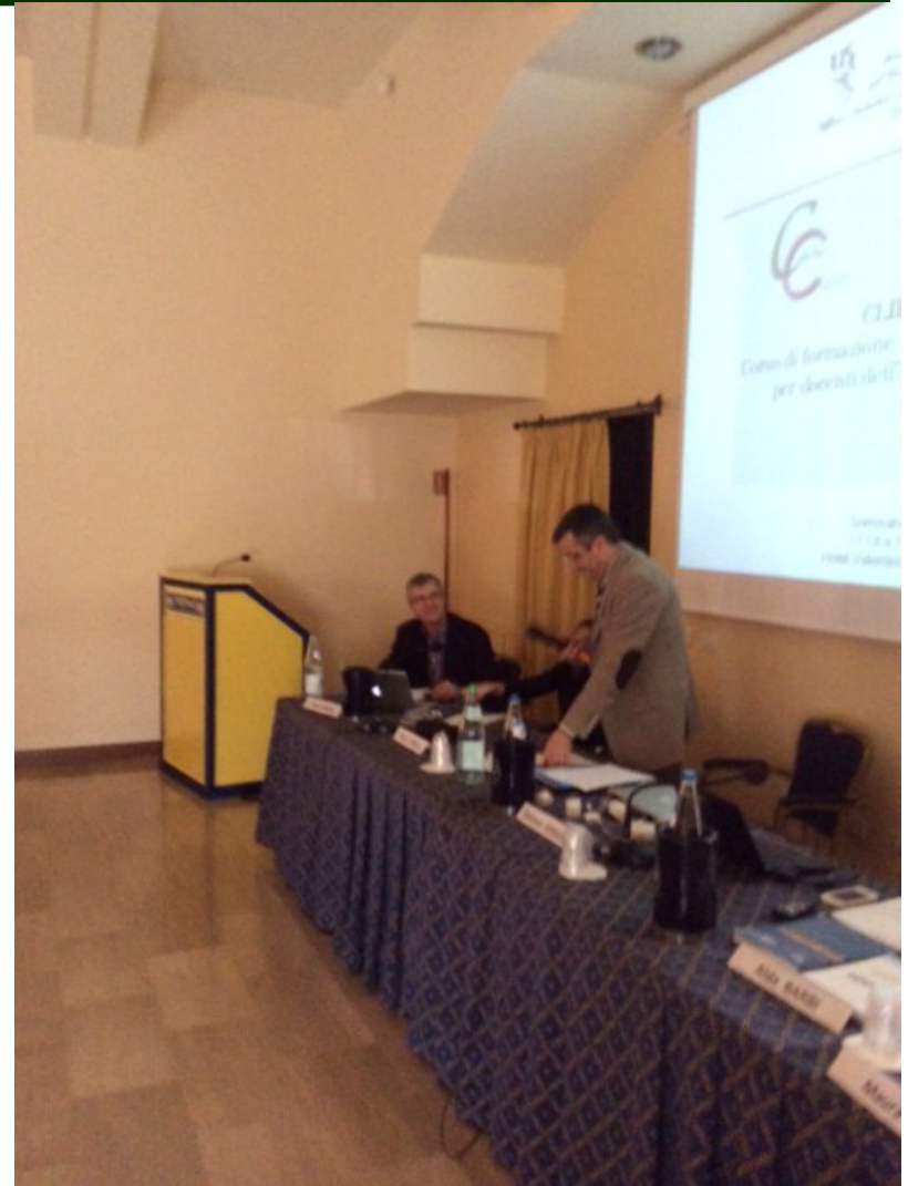
Seminario di fine corso 13 e 14 novembre 2014 Liceo 'Righi'- Bologna