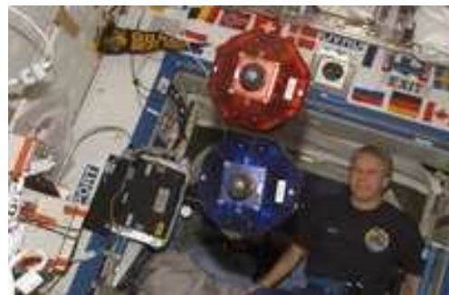
L'astronauta Thomas Reiter con gli SPHERES