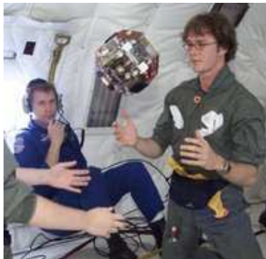
Studenti del MIT che collaudano un prototipo del robot SPHERES

Tre SPHERES in volo libero lavorano insieme all'interno della Stazione Spaziale. Sono indipendenti, ciascuna con la propria energia, i loro propulsori, i computer e i sistemi di navigazione. I risultati ottenuti con questi SPHERES sono importanti per la manutenzione, l'assemblaggio di satelliti, lo studio delle manovre di attracco (docking) e il volo di formazione.