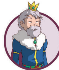
RE DI HEALTH